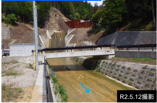
②溪流保全工・砂防堰堤工