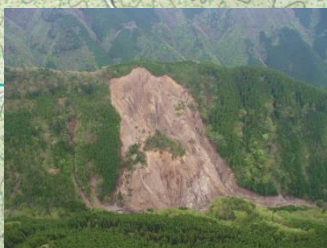
山腹崩壊(小井谷) H27.4撮影