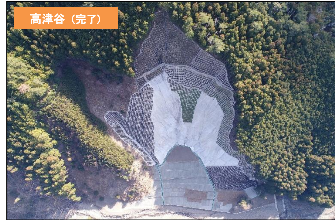
山腹工(法枠工・モルタル吹付工・緑化工) 溪間工(谷止工・護岸工)