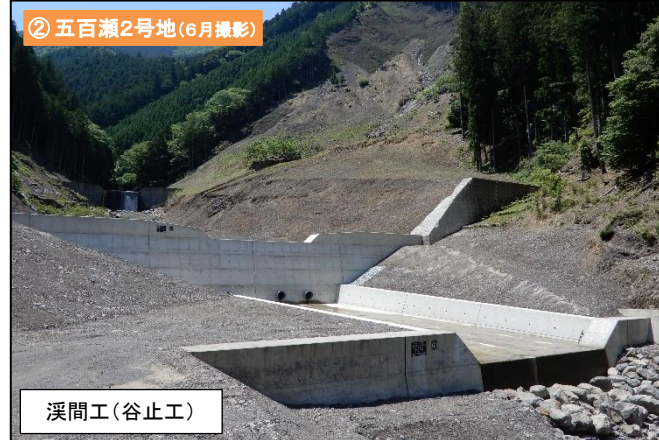
② 五百瀬2号地 (6月撮影)