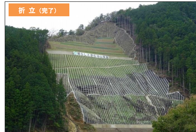
山腹工(法枠工・土留工・緑化工)