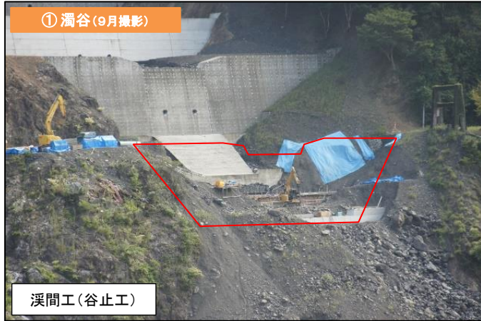
① 濁谷 (9月撮影)