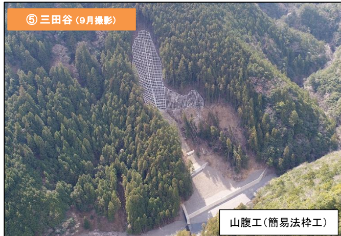
⑤ 三田谷 (9月撮影)