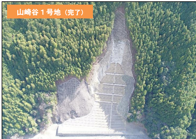
山腹工(法枠工・モルタル吹付工・緑化工) 溪間工(護岸工)