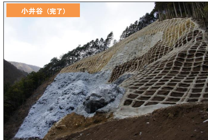
山腹工(法枠工・モルタル吹付工・緑化工)