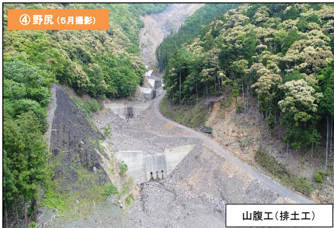
④ 野尻 (5月撮影)