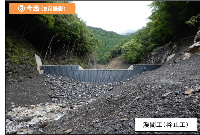
③ 今西 (8月撮影)