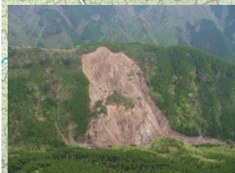
山腹崩壊(小井谷) H27.4撮影