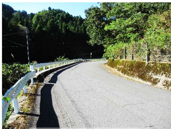
②施工前 (R3年度整備箇所)