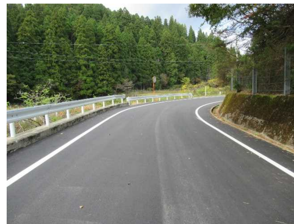
②施工完了 (R3年度整備箇所)