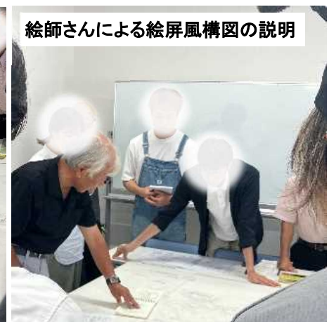
絵師さんによる絵屏風構図の説明