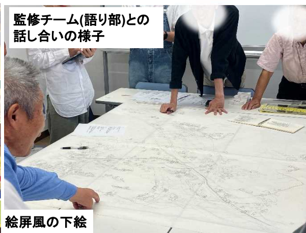
監修チーム(語り部)との話し合いの様子