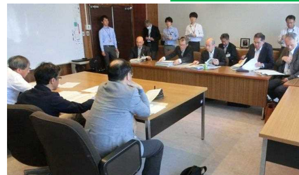
報道関係者への報告と質疑応答状況