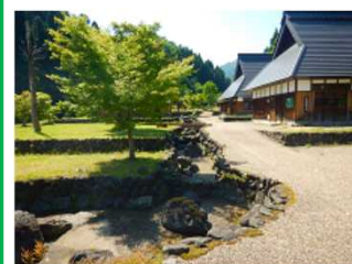
妙理の里 (長浜市余呉町菅並)

委員会資料は次のHPで公開しています>>> https://www.kkr.mlit.go.jp/river/iinkaikatsudou/niu_dam/index.html