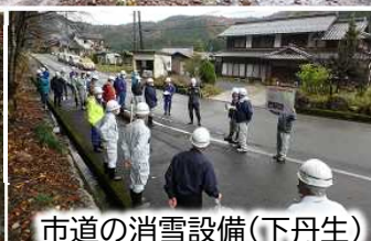
市道の消雪設備(下丹生)