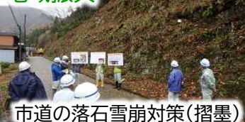
市道の落石雪崩対策(摺墨)