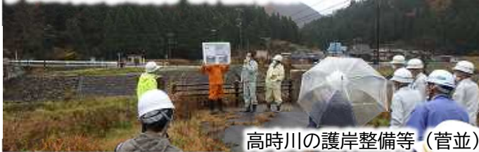
高時川の護岸整備等(菅並)