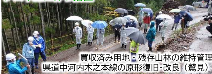
買収済み用地・残存山林の維持管理 県道中河内木之本線の原形復旧・改良(鷲見)