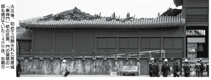
火災後、初めて公開された首里城。奉神門前の4区画、門の屋根の一部も焼けた。4日後、那覇市

「エレベーターやトイレが壊れることは避けたい」と。大森内のタワーマンションに住む60代男性は、川崎・武蔵小杉駅近くの出来事について話している。男性が居住するタワマンの地下には電気室などがある。近くに大きな川はなく、水害リスクはそれほど高くないが、今回の問題を機に管理組合と話し合いたいと話した。