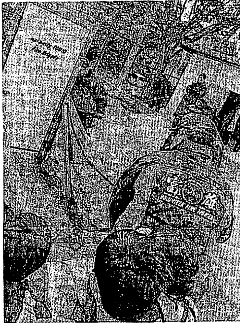
水圧体験を通して、浸水の怖さを体験する子どもたち(同)

南海トラフをはじめ予想される震災への備えとして、年齢を超え子どもから高齢者まで幅広く求められる防災意識。奈良市富雄南中学校区地域教育協議会では、平成26年