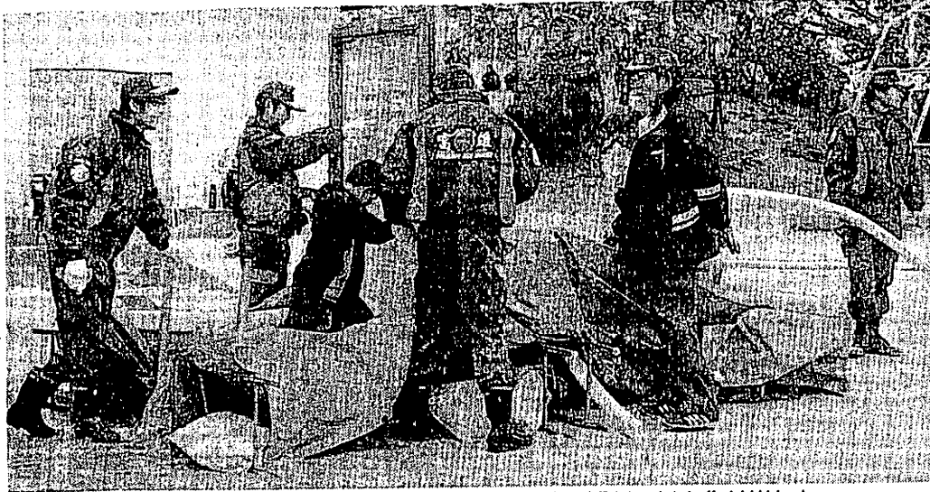
防災フェスタで浸水の疑似体験を行うため、疑似の川を作り出した =昨年12月、奈良市藤ノ木台の市立富雄南中学校