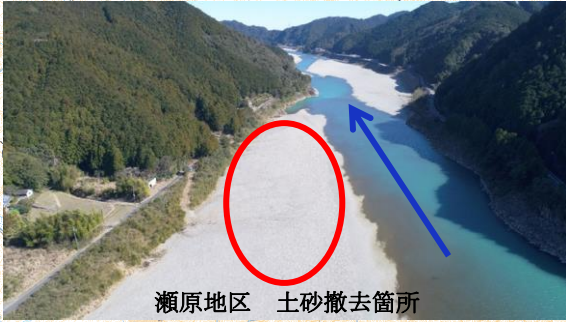
瀬原地区 土砂撤去箇所

令和3年度までの対応 本川堆積土砂の撤去 (推進費) 和気地区 10,000 m 3 (交付金) 和気地区 76,000 m 3 、瀬原地区 9,900 m 3 (砂利採取) 浅里地区 57,000 m 3 支川堆積土砂の撤去 約 160,000 m 3 令和4年度の対応 熊野川支川大又川 2,500 m 3 堆積土砂撤去 (予定) 熊野川支川北山川 13,100 m 3 堆積土砂撤去 (予定)