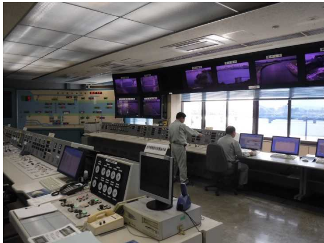
写真：堰管理制御システム（淀川河川）