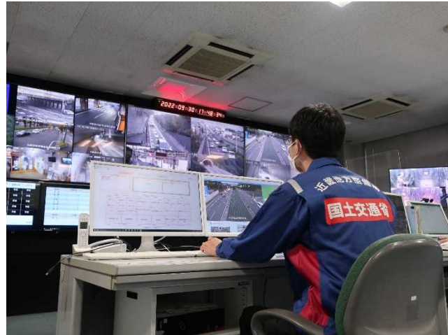
道路情報室（大阪国道）