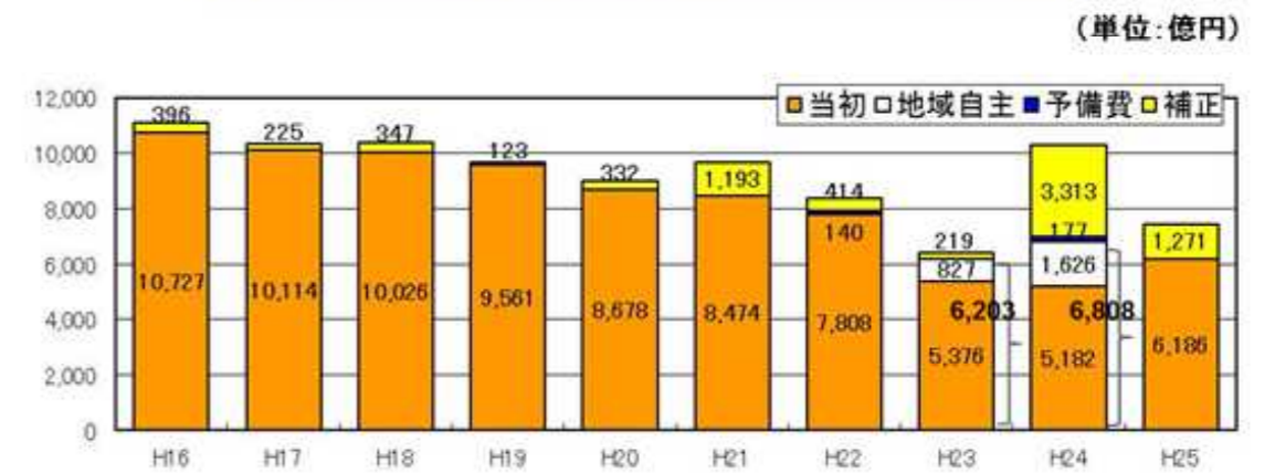
平成16年度以降の当初・補正 予算額一覧 (直轄・ゼロ国除く)