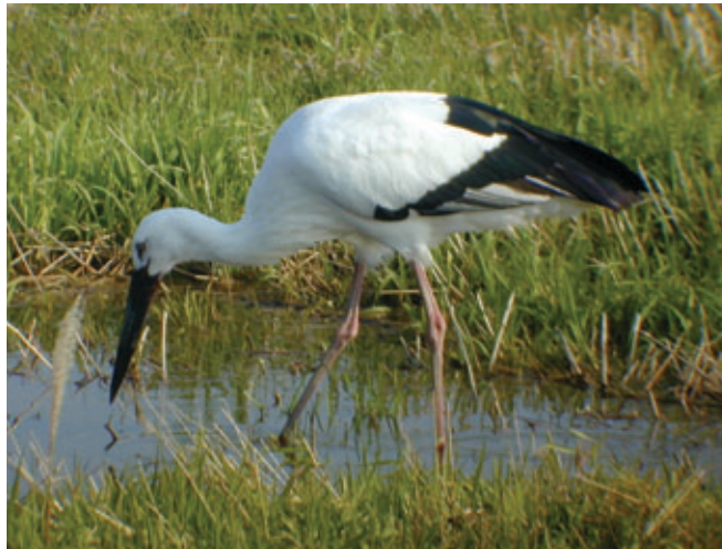
野生のコウノトリ