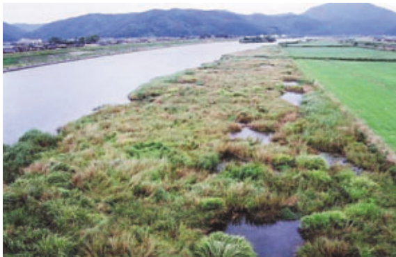
湿地再生のイメージ

円山川において、多様な生物の生息・生育空間の整備をすすめるために、ビオトープ*1のモニタリングを継続するとともに、「円山川自然再生計画」を策定します。また、湿地の確保に配慮しつつ河川改修工事を実施します。