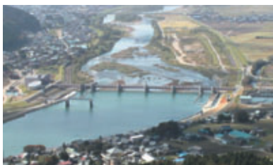
九頭竜川鳴鹿大堰