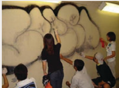
落書き消し隊（活動場所:滋賀県）

鎌倉時代には、地域の人々で生活基盤を造ったり補修を行う「道普請」が盛んに行われていました。近畿地方整備局では、「道」に「未知」をあて、道路だけでなく河川や公園などの公