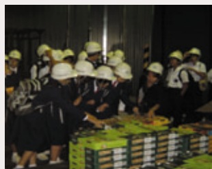
みなとの総合学習風景