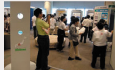
未知普請全国大会（ポスターセッション）