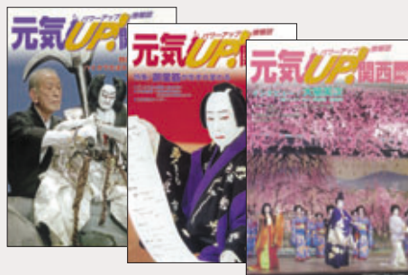
パワーアップ情報誌 ～元気UP!関西～

をはじめ日本全国さらに世界に向けて、関西の元気を発信するものです。これにより、関西が元気あふれる魅力的な地域であり、投資の対象として注目すべき地域であるとの認識を広め、関西の活力を一層高めることを目的としています。