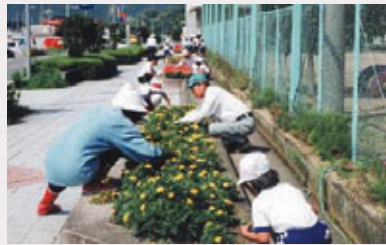
ボランティアサポートプログラム（神野花まるロード:兵庫県山崎町）

共施設も含め、未来を切り開く意もこめて、「未知普請」精神を広く育むべく、平成14年度から「対話と協働」、「参加と責任」、「未知への挑戦」の3本柱をもって「未知普請」活動を推進しています。