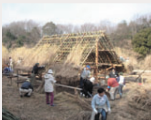
第5回あいな里山まつり