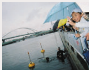
大阪湾再生の取り組み (小学校の参加によるミニ人工干潟の実験状況)