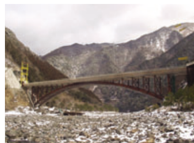
五條新宮道路 宇宮原バイパス (田長瀬橋)