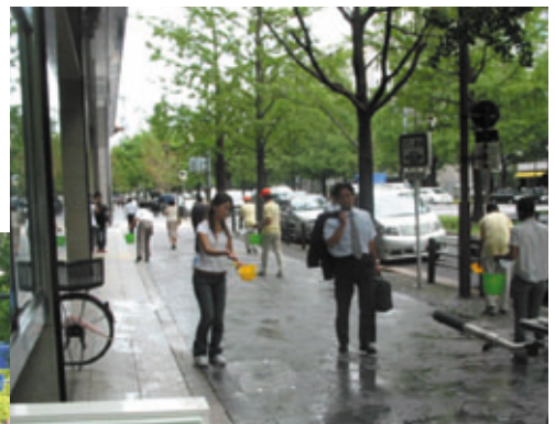
打ち水大作戦(平成16年8月18日・25日)

平成17年度は、引き続き橋梁の架替等を行うとともに、地下通路等の歩行支援施設を完成させる予定です。