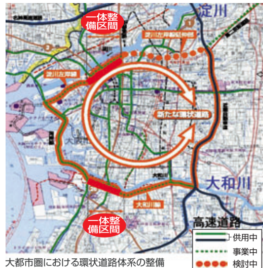
大都市圏における環状道路体系の整備