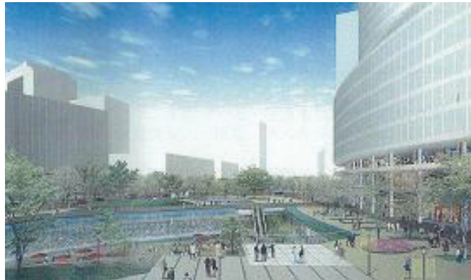
大阪駅北地区の整備イメージ

大阪駅北地区の優位性を活かし関西経済の活性化や都市魅力の創出に向けた都市基盤施設の整備を行い、国際的な企業の集積や新産業の立地の支援、日本の国際競争力の強化、関西の都市再生を担う拠点の形成を目指します。