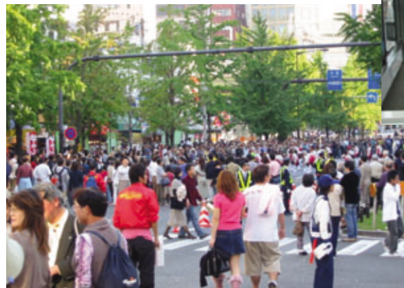
御堂筋オープンフェスタ2004(平成16年10月17日)

大阪のメインストリートである御堂筋は、業務・商業・文化面にわたり大阪の中枢機能を担っていますが、人が集える、楽しめる空間の不足等、沿道の活気が急速に失われつつあります。このため、民間団体のまちづくり活動が高まる中、業務・商業等の機能の高度化した集積地を形成する御堂筋活性化の取り組みの支援を行います。