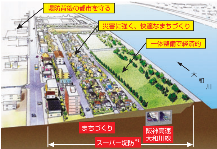
スーパー堤防(イメージ)

阪神高速大和川線地区等について、高規格堤防整備とまちづくりの一体整備を進めます。