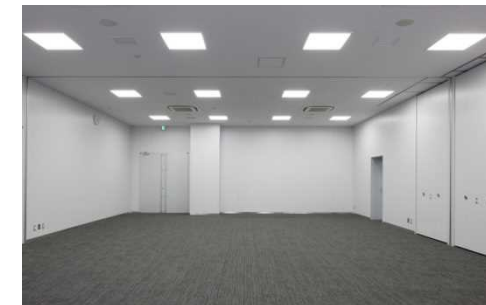
可動間仕切の活用 (会議室)