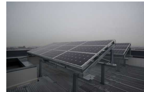
自然エネルギー利用のための特別な対策（太陽光発電）