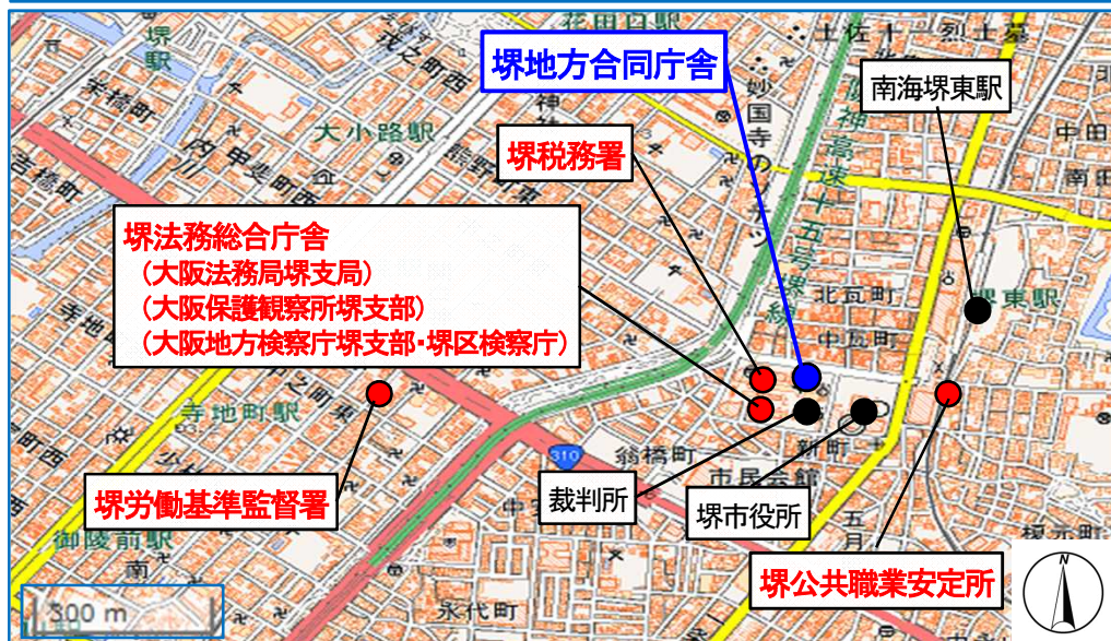
堺地方合同庁舎と整備前の各入居官署庁舎の位置図