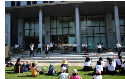
敷地の一体利用 （市民交流広場の活用状況）