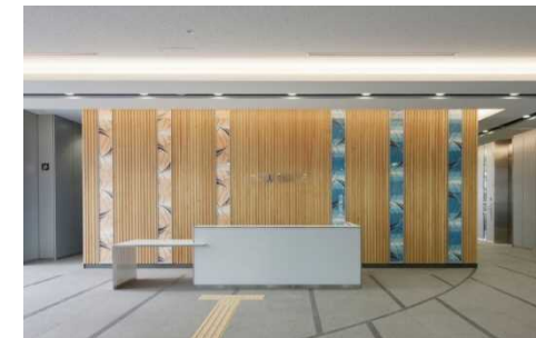
内装の木質化（1階総合受付）