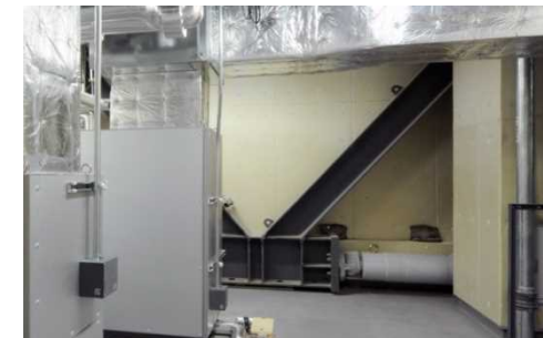
地震への特別な対策 (制振装置)