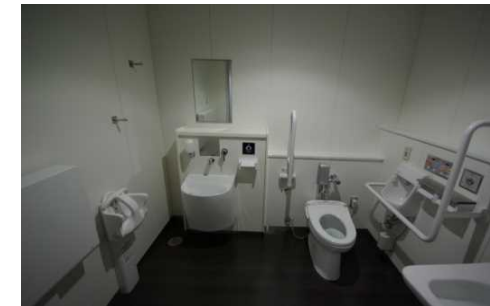
多機能トイレを各階に設置