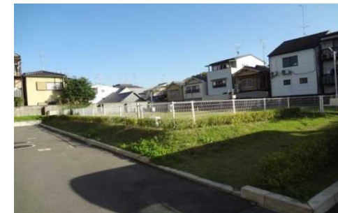
浸水への特別な対策 (気象観測機器設置部の嵩上げ)