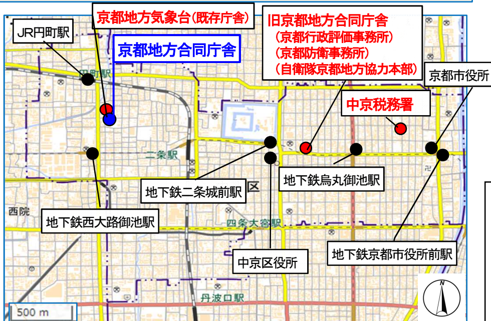
京都地方合同庁舎と整備前の各入居官署庁舎の位置図