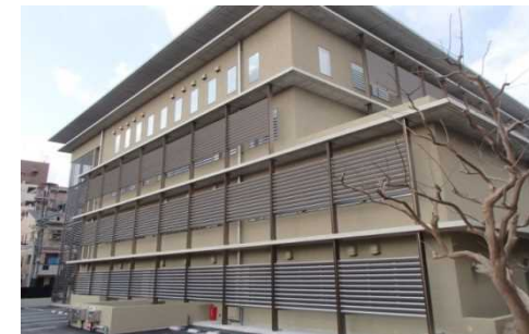
歴史・文化及び風土への配慮 (土壁をイメージした外装材、庇・格子の採用)