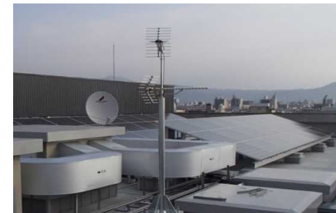
自然エネルギー利用のための特別な対策 (太陽光発電)