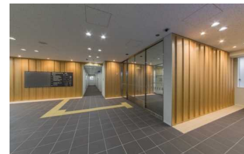
内装等の木質化 (玄関ホール)