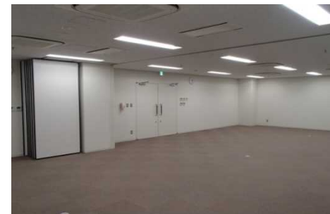
可動間仕切の活用 (会議室)