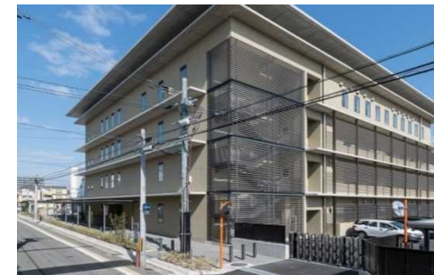
敷地の一体利用 (庁舎西側の歩行者通路整備)