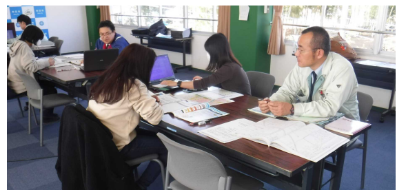
図-2 「作成講習会」での支援状況 （上：全体進行説明状況、下：対面方式での支援状況）