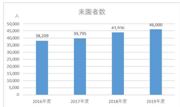
図-4 来園者数の推移

里山学習プログラム参加者の満足度は高く、来園者の増加にもつながっているといえる。