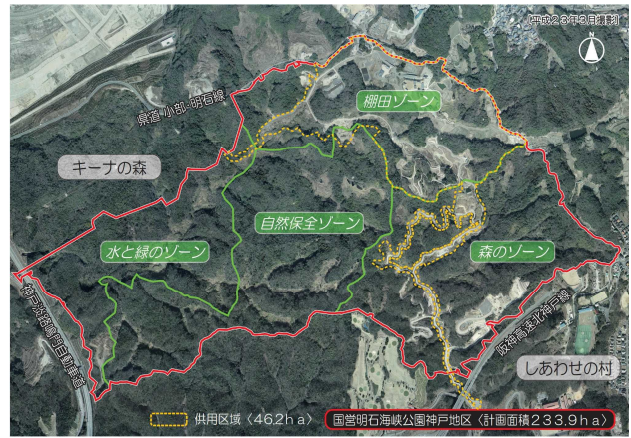
図-5 国営明石海峡公園神戸地区

今後は、棚田などの里地里山景観を保全・継承しながら、里地里山の生活技術や歴史・文化を継承する「棚田ゾーン」に続く開園区域として、美しい風景を創出しながら、幅広い世代による余暇活動や自然環境の大切さを学習する場である「森のゾーン」を整備し順次開園していく予定である。