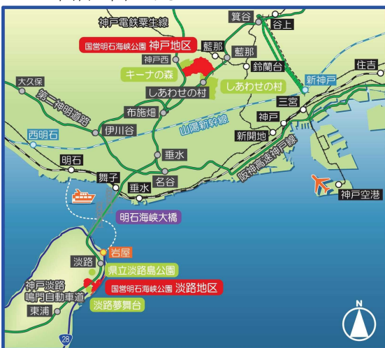
図-1 国営明石海峡公園周辺図

国営公園は広域的・多様化するレクリエーション需要に対応するため、又は我が国固有の歴史的風土や文化財を保存・活用し未来に伝えるため、地域づくりへの貢献等国交省が全国17箇所で開催を行っている都市公園である。その16番目である国営明石海峡公園は、明石海峡を挟んで兵庫県淡路市の「淡路地区」と兵庫県神戸市北区・西区の「神戸地区」の2地区からなる全体計画面積330haの国営公園である。