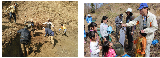
図-3 左：かいぼり 右：生物調査

2019年度は「アメリカザリガニ捕獲大作戦！」として、須磨水族園の協力のもと「かいぼり」とアメリカザリガニ等の外来種駆除を実施した。