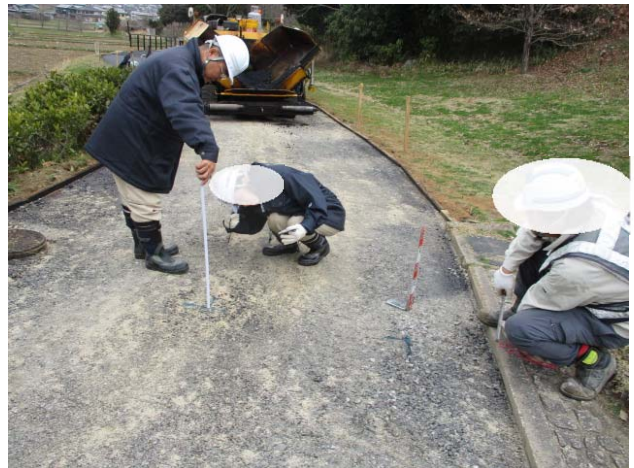
写真4: ミリ単位の路盤の出来高管理に驚く若手技術者A技官