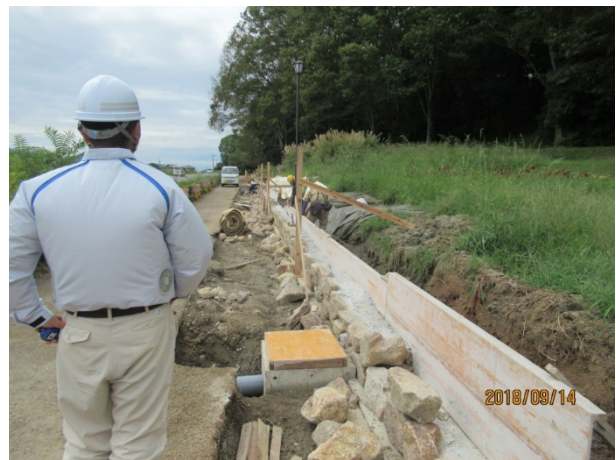
写真1：ものづくりの現場から若手技術者へ技術の橋渡しを考える。

国土交通省に勤務して20年以上経つが、私自身、それほど技術力に自信があるわけではない。しかし、これまで先輩方や、関係者の方から多くの事を学んできたことは事実である。今、自分に何ができるのだろうか。 これまでのキャリアを少しでも、若手技術者に伝える機会はないだろうか。 そんな想いや、若手技術者に関わる立場でないジレンマに馳せながら、当時、現場監督を行っていた。