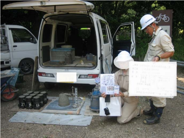
写真2: コンクリート性状試験の立会状況