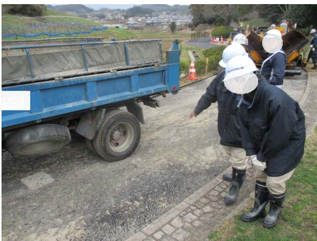
写真3: プルーフローリング試験の立会状況

自然色舗装の現場到着温度、敷均し温度、締固め温度、開放温度、プルーフローリング試験