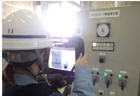
写真-2 新規採用職員による運転操作状況

そして、その操作記録は自動作成され、操作報告書の作成時間の大幅な短縮に繋がった。