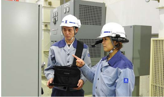
写真-1 職員支援システム使用状況