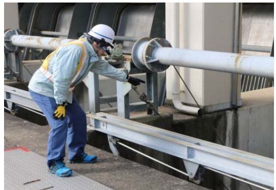
写真-3 流木集積時の対応状況

不具合対応支援システムについては、同じく2017年の防災業務時に排水機場スクリーン前面部に大量の流木が集積した際、専門技術職が現地に向かわずとも現地班から送信された画像等の情報により遠隔地から対応を指示し、ポンプを停止するに至らず、運転を継続することができた（写真-3）。