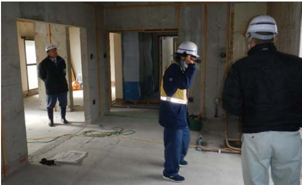
写真-7 抜き打ちパトロール状況

このように少人数で実施する抜き打ちパトロールでありながら、多くの目で指摘できることから効率的なパトロールと言える。また、HMD装着者を若手職員とし、支援者（総合管理所）側から不安全行動を指摘することで、若手職員の安全教育ツールとしても期待できる。