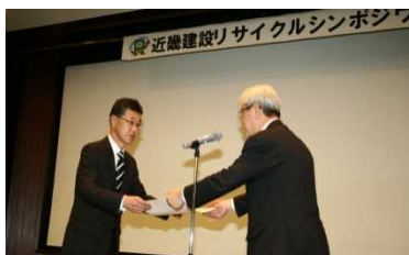
谷本局長より表彰状授与