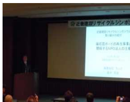
有限会社 ラルス 渋谷氏