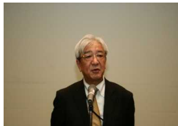
開会挨拶(谷本局長)