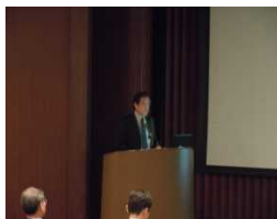
田中建材 株式会社 田中氏