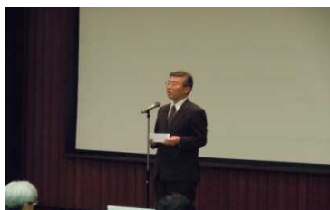
山田審査委員長より講評