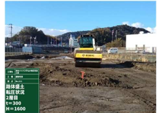
路体盛土工、建設汚泥処理土の活用