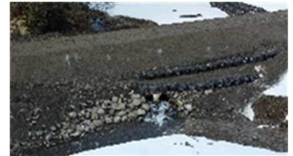
法面保護用の転石の設置