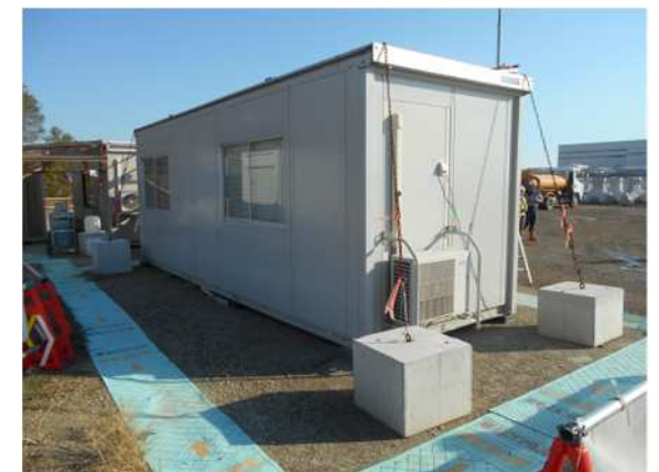
残コンを利用したブロック