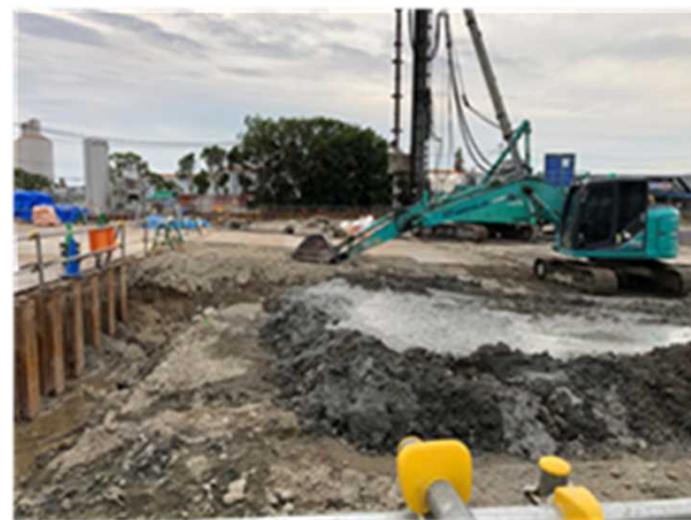
建設汚泥の再生利用