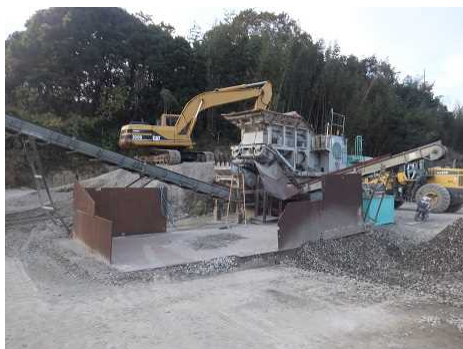
再生砕石用プラント