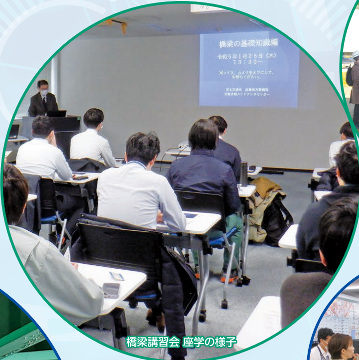
橋梁講習会 座学の様子