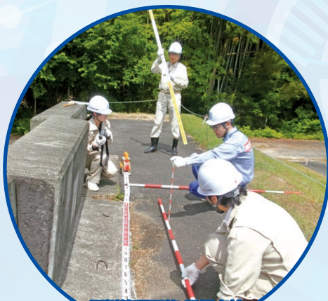
河川管理研修 自視点検

近畿地方整備局では、行政課題を解決するうえで 有用と思われる研修や講習会、出前講座を多数ご用意しております。