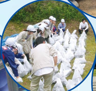
河川管理研修 水防工法の実習