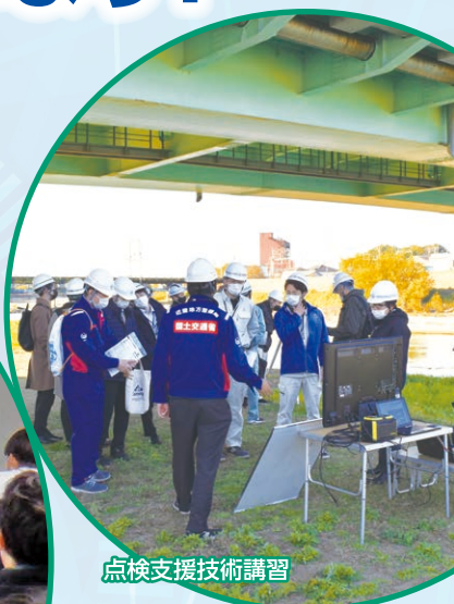
点検支援技術講習