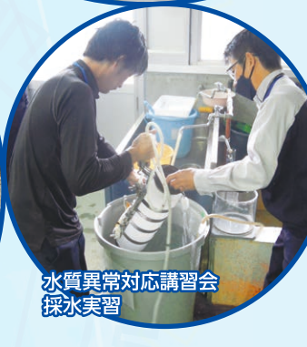
水質異常対応講習会 採水実習