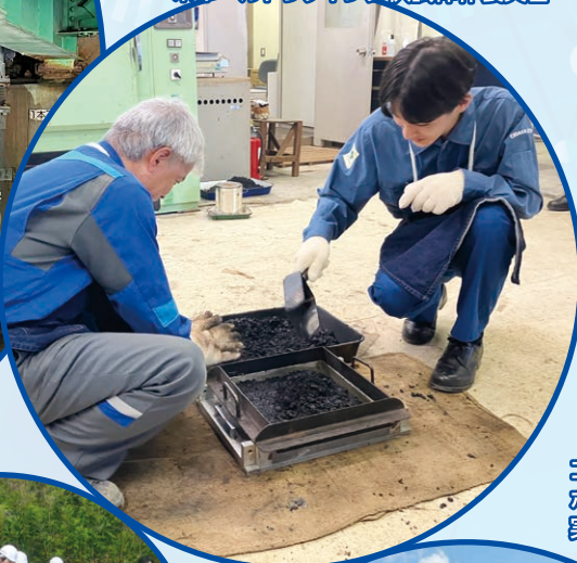
アスファルト試験講習会 ポリアルトラッキング供試体作製実習