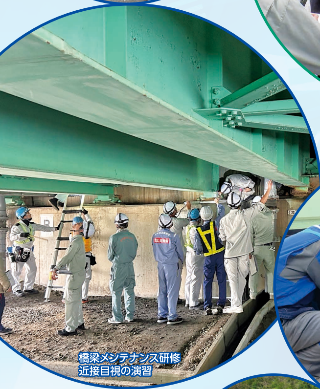
橋梁メンテナンス研修 近接目視の演習