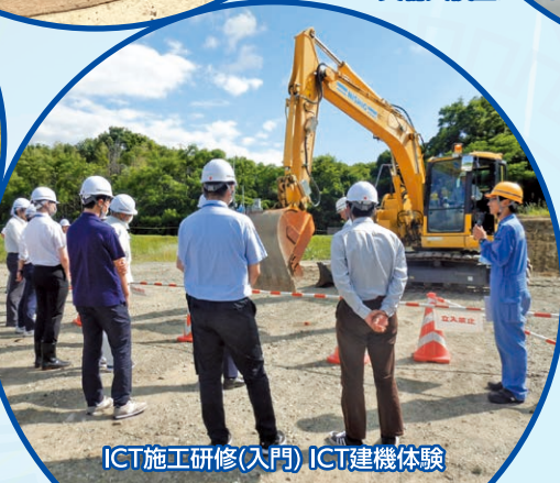
ICT施工研修(入門) ICT建機体験