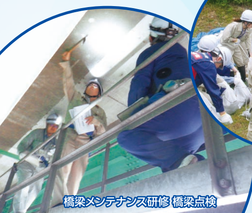
橋梁メンテナンス研修 橋梁点検