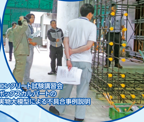
コンクリート試験講習会 ボックスカルバートの 実物大模型による不具合事例説明