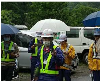
▲実際に無線機を使用して通信相手と話し、無線機の操作方法を確認しました。