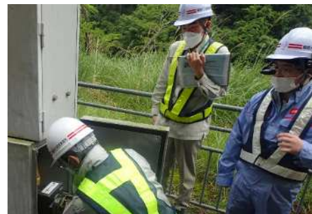
▲ウェアラブルカメラを使用して訓練の様子を事務所に配信しています。