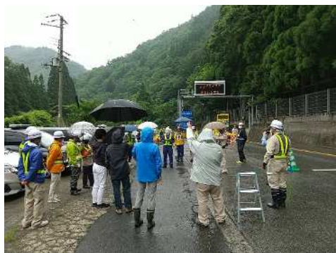
▲当日は取材がありました。