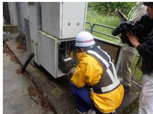
▲手動でも遮断機を下ろすことは出来ます。 万が一に備え手動での操作も実施しました。