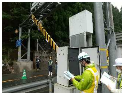
▲遮断機の操作を行いました。 梅雨の大雨や台風への備えは着々と進んでいます。