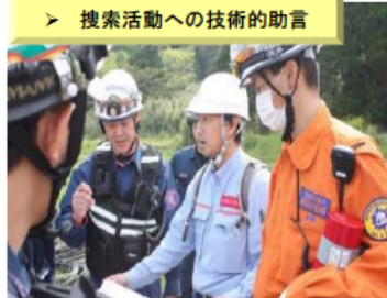
【H28.4 熊本地震】 (熊本県南阿蘇村)