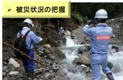
【令和2年7月豪雨】 (熊本県五木村)