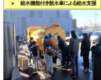
【R6.1能登半島地震】 (石川県かほく市)