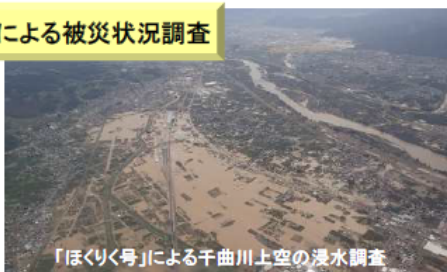
【令和元年東日本台風】 (長野県長野市上空)