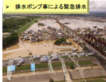
【H30.7月豪雨】 (岡山県倉敷市真備町)