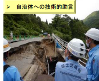
【令和4年8月の大雨】 (山形県米沢市)