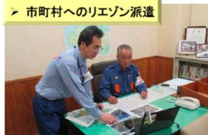
【H27.5 口永良部島の火山活動】 (鹿児島県屋久島町)