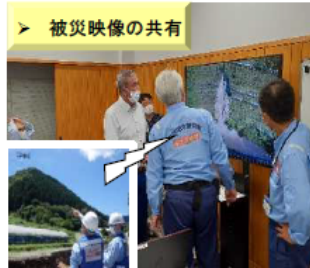
【令和3年7月1日からの大雨】 (島根県飯南町)