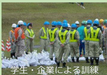
学生・企業による訓練