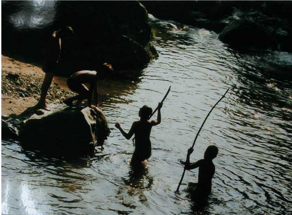
[近畿地方整備局長賞]