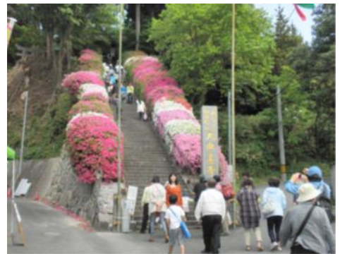
【大興善寺つつじまつり】

国指定史跡「 きいじょうあと 基肄城跡」及びその周辺地域と、基肄城に係る だいこうぜんじ 顕彰活動や大興善寺つつじまつり、 みゆきまつり 農耕祭事である御神幸祭や霊場札所を巡るどろどろまいりといった伝統行事等からなる歴史的風致の維持向上を図るため、基肄城跡の顕彰に関わる建造物や大興善寺の保存修理、御神幸祭の催行ルートとなっている道路の美装化、伝統行事で使用する用具の修理費や後継者育成に係る支援に関する事業等が位置づけられています。