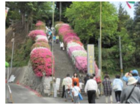
【基山町】大興善寺つつじまつり