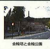
金輪塔と金輪公園

重点区域内に点在する寺院や堂塔等の歴史的建造物について、保存活用を図るため、歴史的風致形成建造物に指定し、修繕や耐震・防災対策等を行う。金輪公園の整備に合わせ、公園内にある金輪塔の整備を図る。