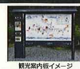
観光案内板イメージ

文化財等の歴史資産や歴史的なまちなみ等について、多言語解説及び二次元コード付の案内板や標識を整備することにより、外国人観光客等へ効果的な情報発信を図る。