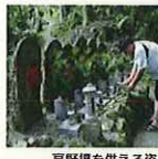
高野槭を供える姿

高野槭は、その名からも想像されるように、高野山と非常に関係の深い植物である。高野山では、古来より高野槭は霊木として保護育成されてきた。高野山を中心とした地域では、多くの歴史的建造物や石造物に高野槭が供花され、集落の周辺には整った模様が広がり、町中では参詣土産に高野槭を求め参詣者と販売する住民の姿がみられる。このような真言密教の根本道場である高野山と高野槭の関係により形成された独特の景観は、後世に伝えていくべき歴史的風致である。