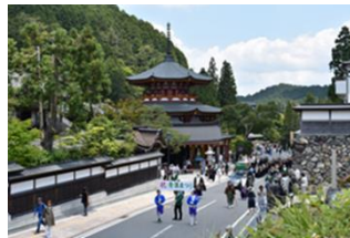
【高野町】宗祖降誕会（青葉まつり）

今回の認定により、当該計画の認定都市数は、72市町となります。（詳細は別紙参照）