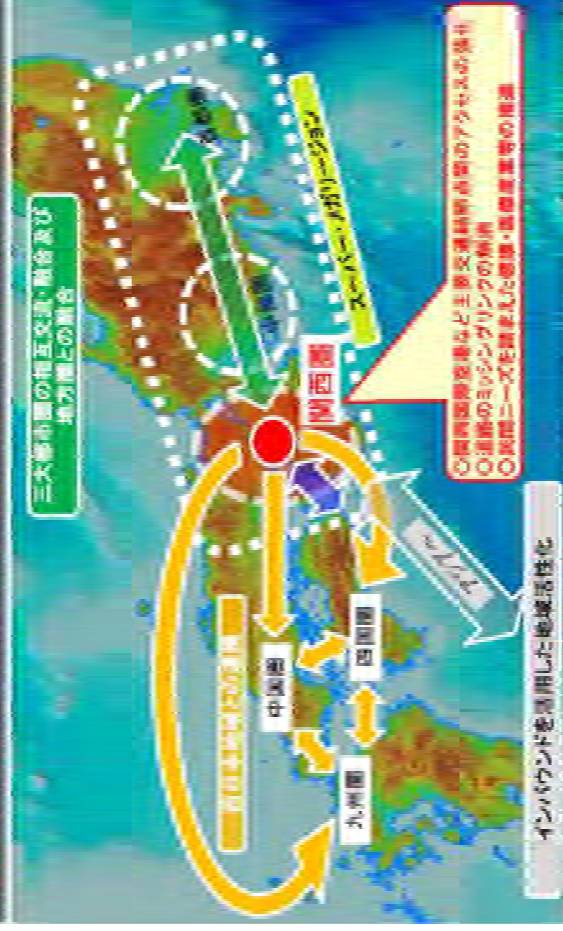
【SMP形成：リニア大阪開業（2045年から最大8年前倒し）以降】