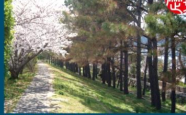
江戸時代に築かれた津波防壁のための堤防