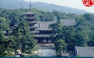
世界文化遺産 法隆寺