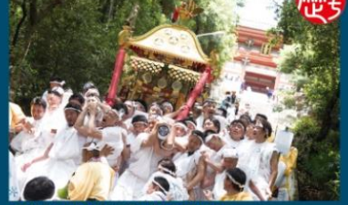
江戸時代から続く紀州東照宮例大祭「和歌祭」