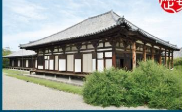
国宝元興寺極楽堂（本堂）