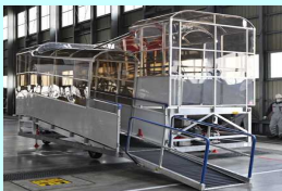
①小型機向け搭乗スロープ ②「サイドリザベーション」方式 ③車椅子利用者単独乗降の様子 ④UDタクシー乗場の整備 ⑤バリアフリー調査の実施