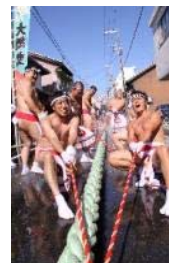
福良夏祭り 大綱引き （8月）