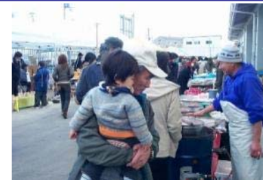
うずしお朝市 （毎月第4日曜）