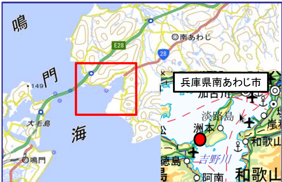
国土地理院地図（電子国土Web）（ http://maps.gsi.go.jp ）をもとに国土交通省作成