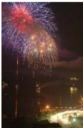
福良湾海上花火大会 （8月）