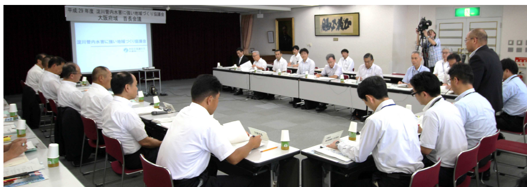
前回の「首長会議(大阪)」の開催状況