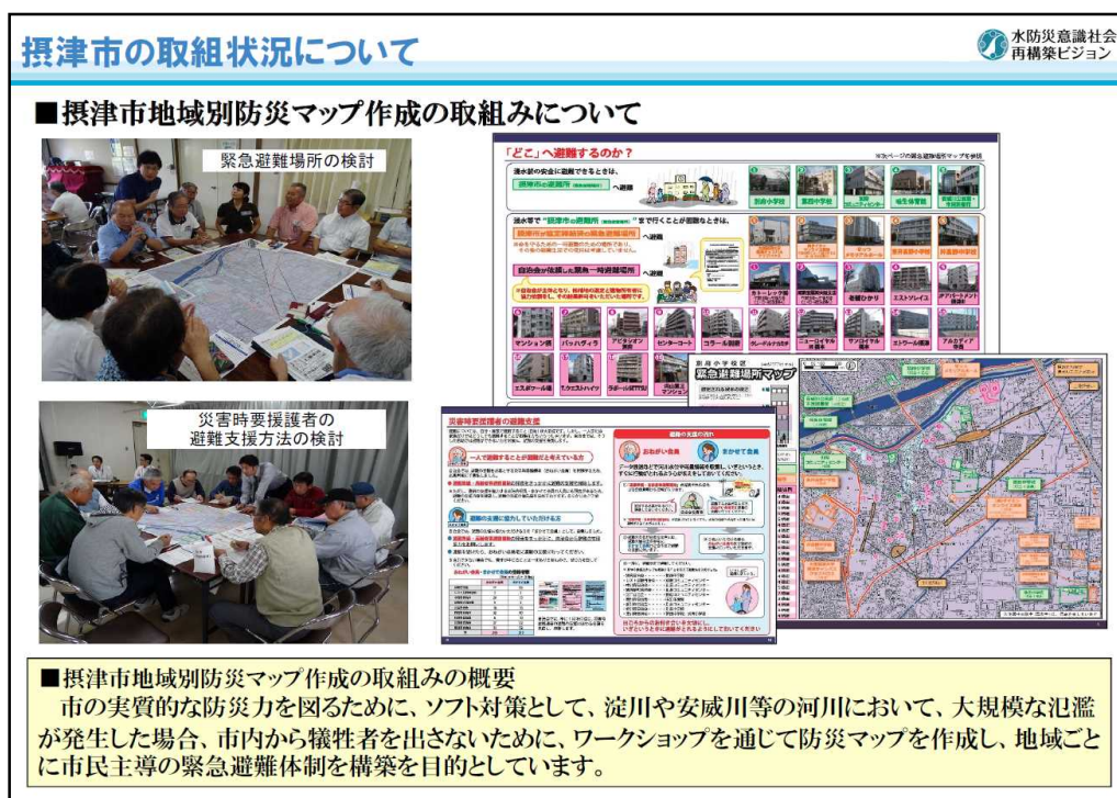
前回の「首長会議(大阪)」における情報共有の一例

前回の首長会議(大阪)は、平成29年8月21日に開催し、水防法の一部改正を踏まえ本協議会が大規模氾濫減災対策の法定協議会へ移行することを確認しました。また、出席された首長からは「取組みが発展し『自分たちの地域は自分たちで守る!』として地域で防災マップを作成する自治会が増えている」など、水災害の減災に関する貴重な情報共有の場となりました。