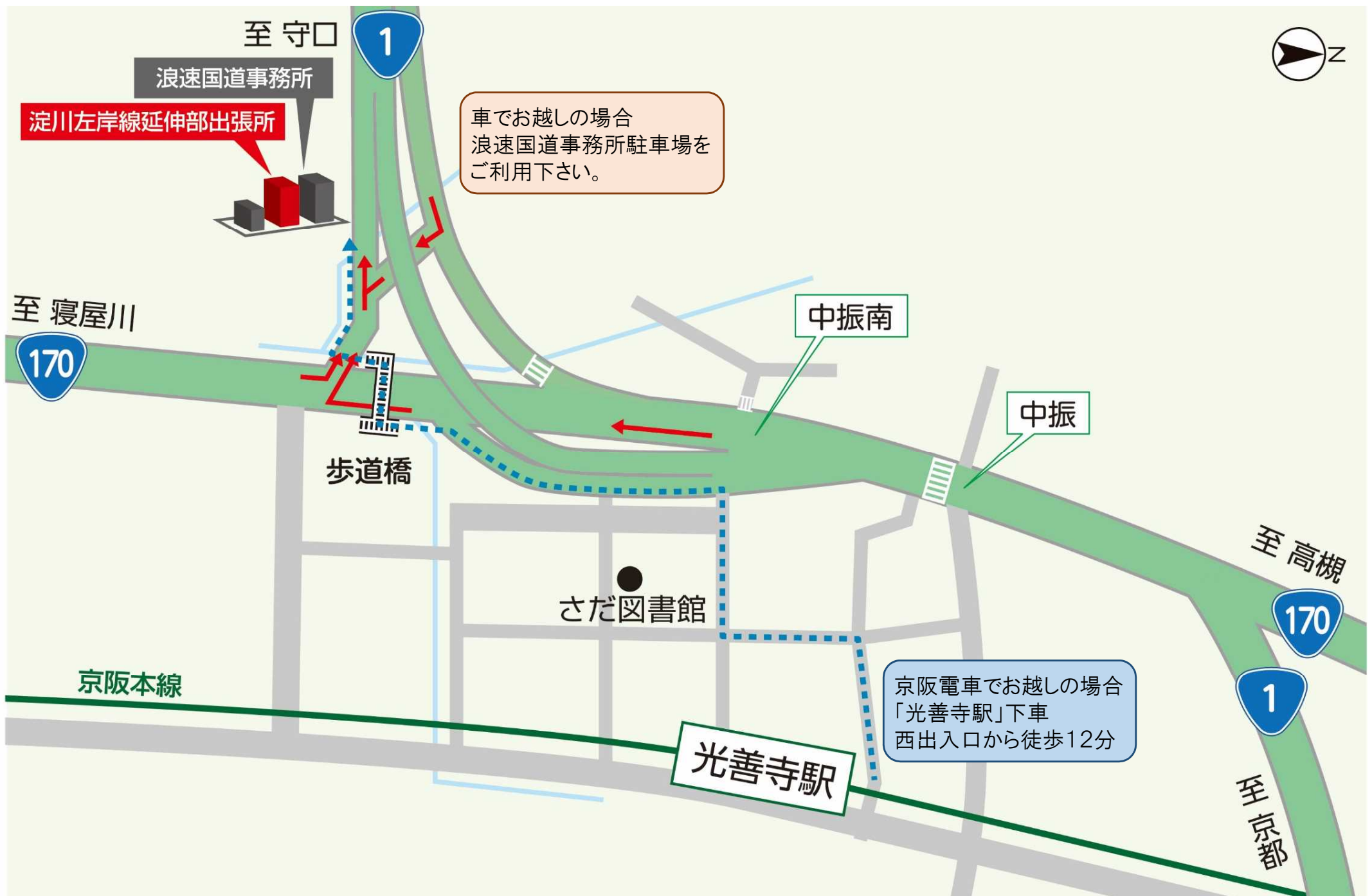
淀川左岸線延伸部出張所までの交通アクセス