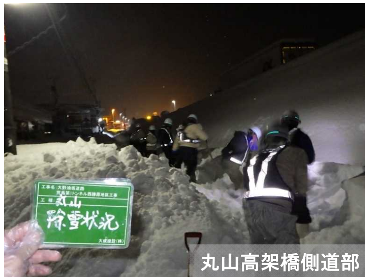
丸山高架橋側道部