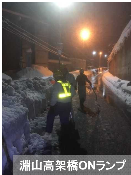
淵山高架橋ONランプ