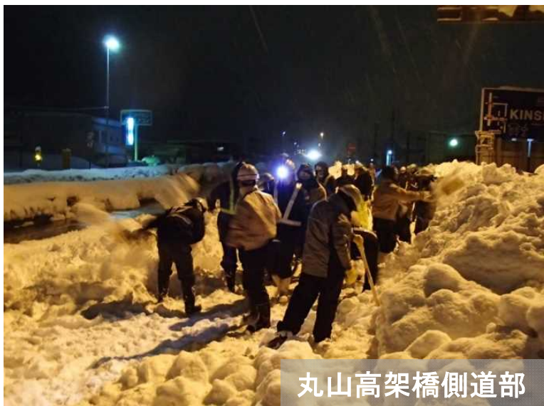
丸山高架橋側道部