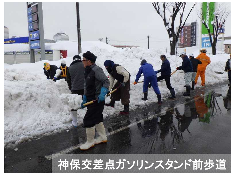
神保交差点ガソリンスタンド前歩道