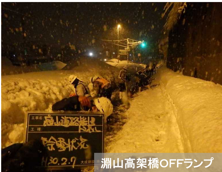
淵山高架橋OFFランプ

◆ H30.2.7(水)～8(木)日本建設業協会連合会関西支部からの支援で、「包括的協定」に基づき除雪要員延べ131名が派遣。昼夜にわたる人海戦術により、除雪にあたって頂きました。