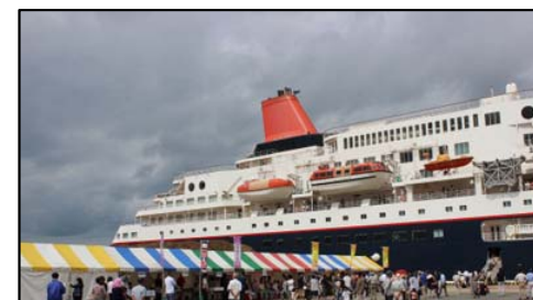
大型客船「にっぽん丸」寄港