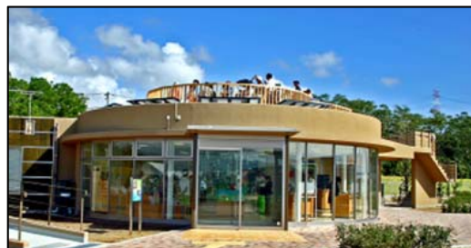
日高港新エネルギーパーク