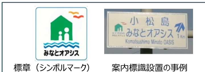
標章（シンボルマーク）