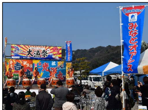
「みなとオアシス」における地域振興イベント