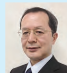
■国際港湾協会(IAPH) 副会長 篠原 正治