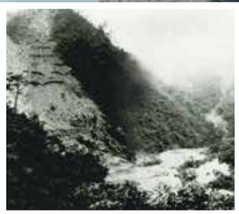
岩屋堰堤上流右岸の山腹崩壊状況 (神戸市兵庫区里山町)