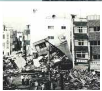
宇治川商店街のビル倒壊と流木の堆積状況 (神戸市中央区)