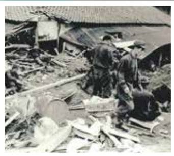
崩壊土砂により埋没した家屋からの救命作業 (神戸市長田区明泉寺町)