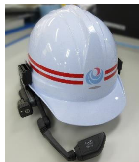
ウェアラブルカメラ取付時

日 時：令和7年6月3日（火）14：00～15：00 場 所：国道29号 宍粟市波賀町原地先・赤西遮断機前 参加者：姫路河川国道事務所 職員（23名） 道路維持業者（5名） 内 容：遮断機操作方法説明、訓練 K-λ（陸上移動無線）操作訓練 ウェアラブルカメラ画像送信訓練 マスコミ：読売新聞、神戸新聞