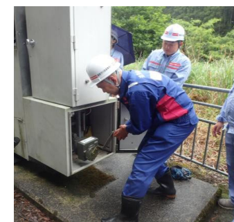
遮断機手動開閉訓練