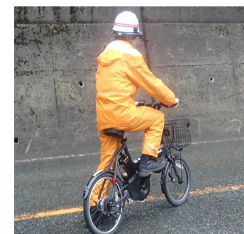
ウェアラブルカメラ走行訓練