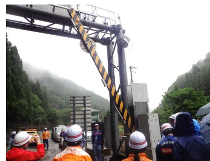
遮断機電動開閉訓練