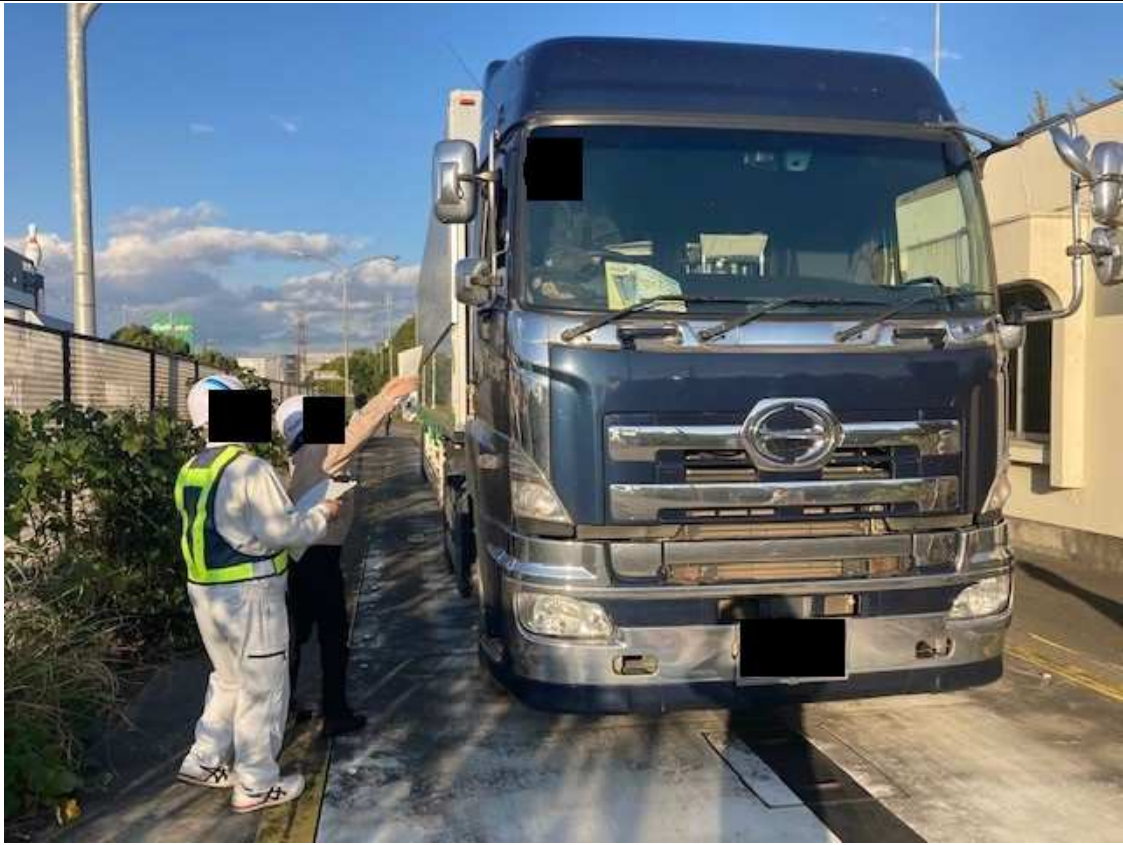
【国道1号 大阪府枚方市】