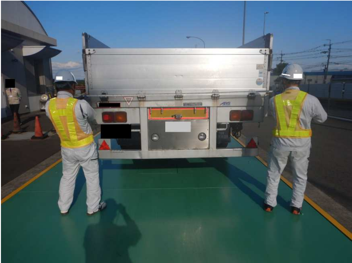
【国道1号 京都府八幡市】