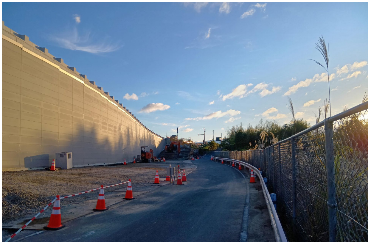
みなみそくどうしげきじんりょうせん 市道南側道重行神領線 11月25日撮影

これまで実施しているモニタリング計測は恒久対策が完了するまでは引き続き継続します。