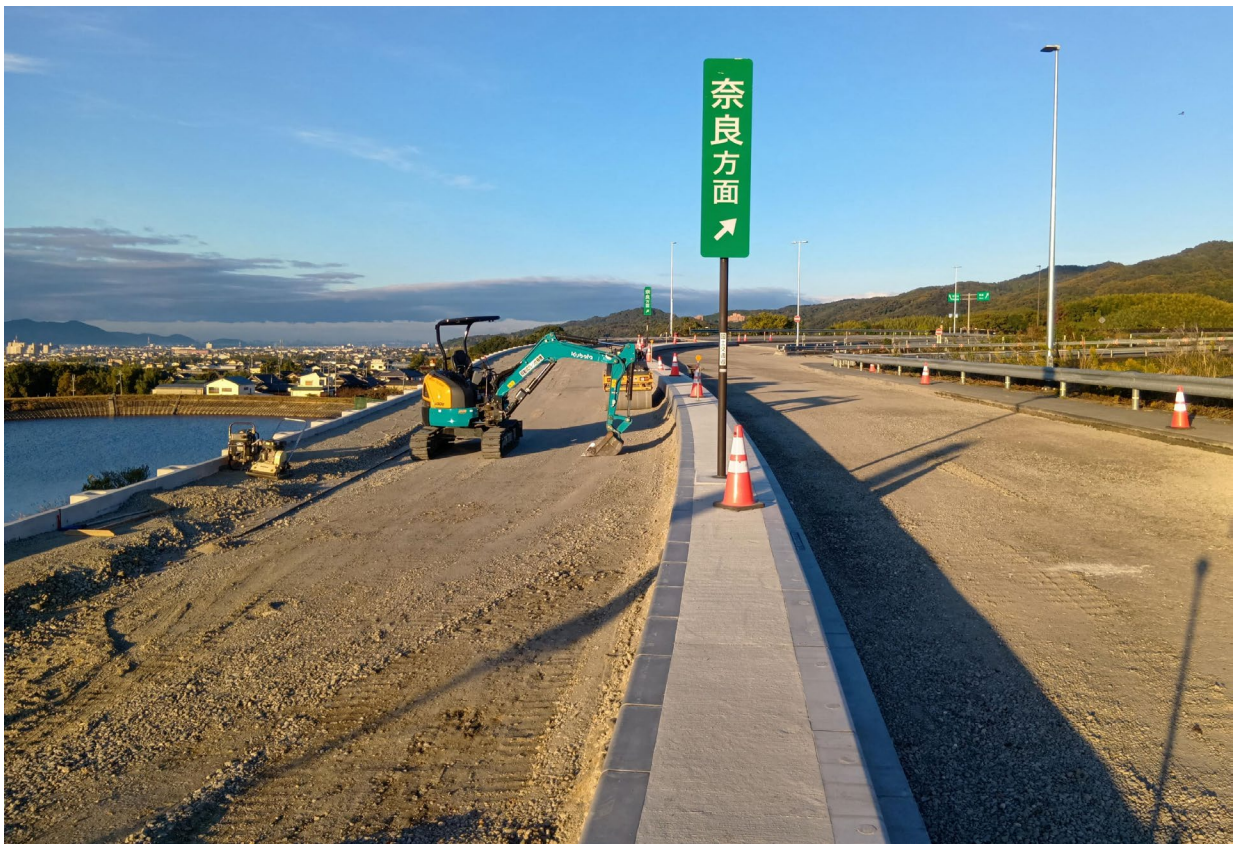
紀の川ICランプ部 11月25日撮影