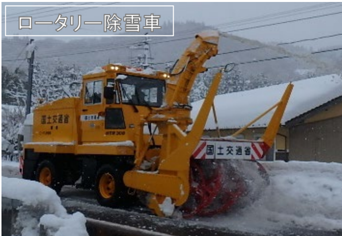
ロータリー除雪車