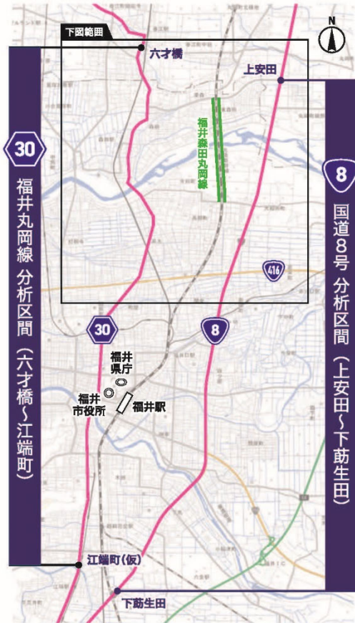
【地図】地理院地図を加工して作成